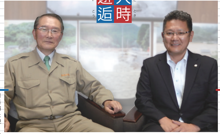
芦北町庁舎にて(2021年5月19日)

1970年生まれ、大分県佐伯市出身。『ホテルAZ』を全国85店舗展開する『株式会社アメイズ』の代表取締役社長に2016年就任。柔道初段。趣味はラジコン、ドローン、ロードバイク。